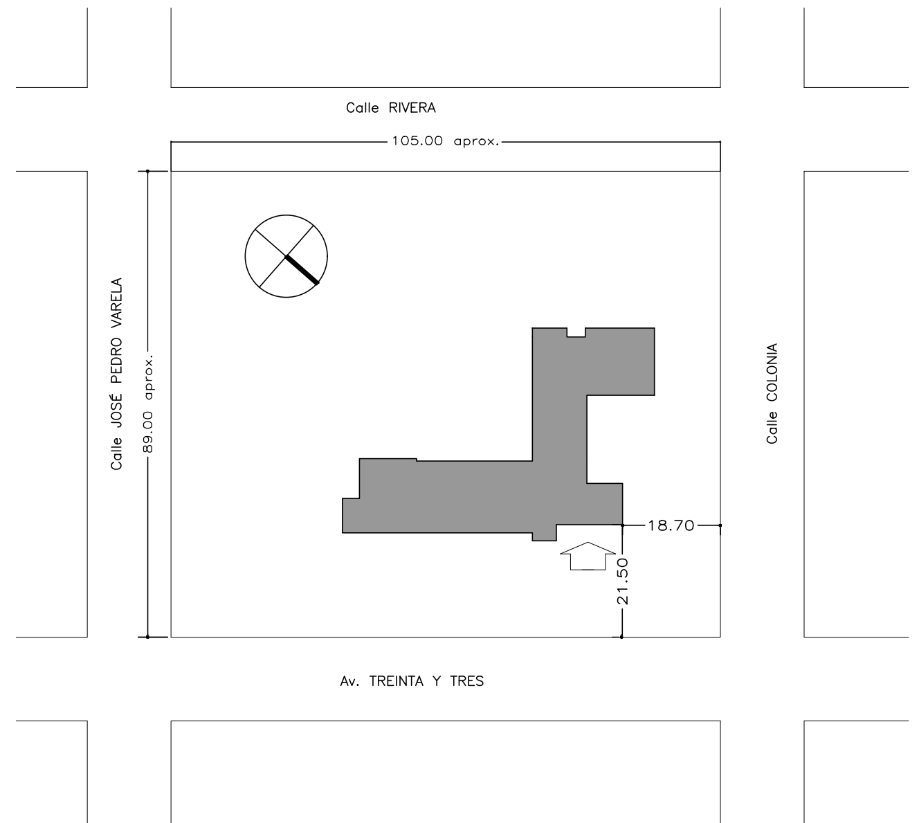
PLANTA DE UBICACIÓN Esc 1/1000